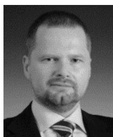
Petr Fiala 1.8.2009–31.7.2011