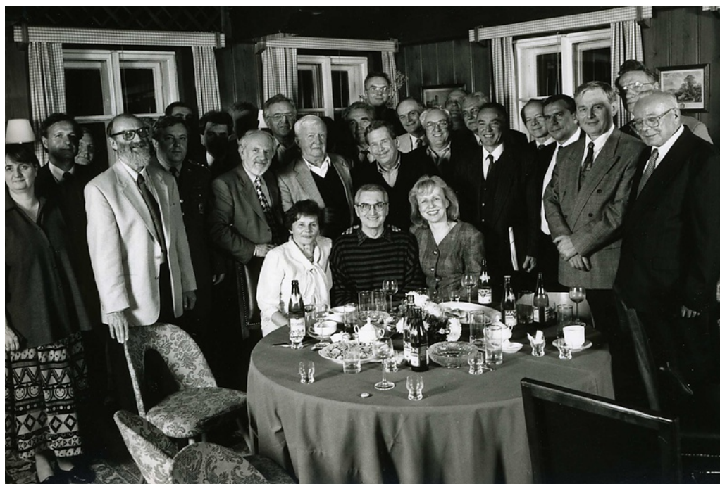
Setkání rektorů s prezidentem Václavem Havlem po 25. zasedání Pléna ČKR Lány, Vila Amálie, 3. května 1996